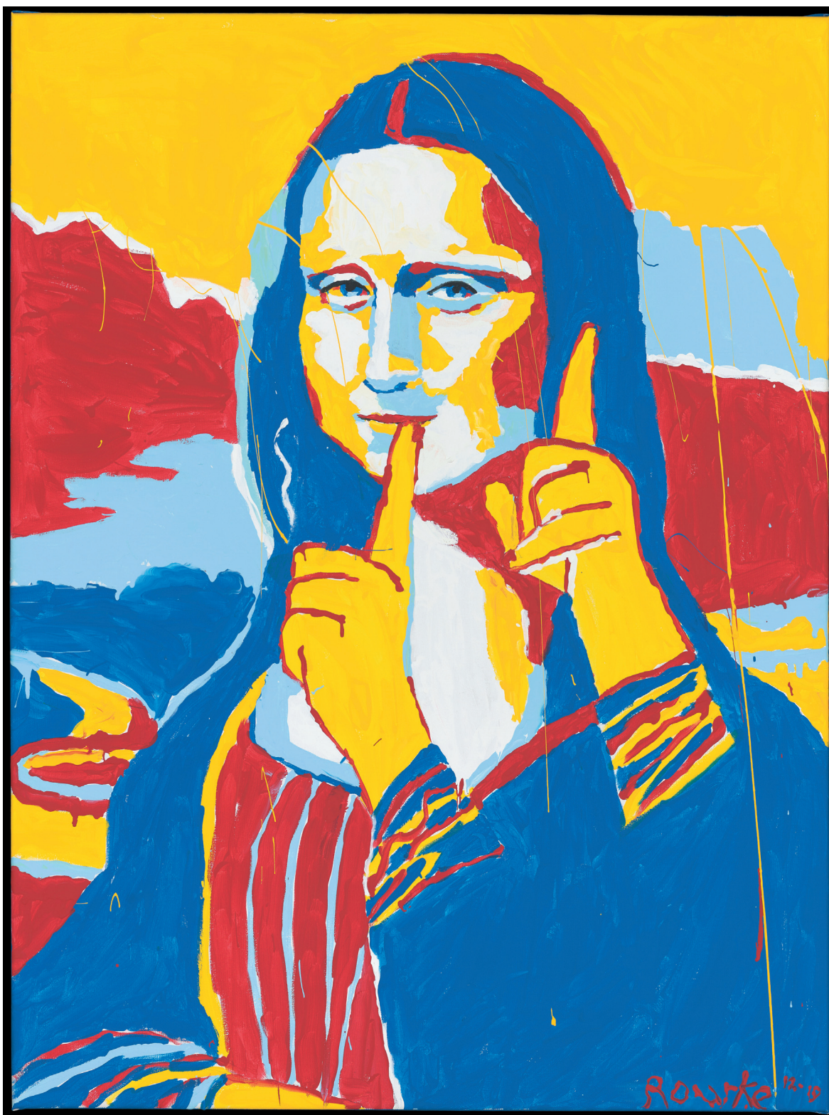
5. Nancy Rourke, Mona Lisa Glucha (Mona Lisa Deaf Revisited) , 2020, farby lateksowe, płótno, 152,5 x 91,5 cm, własność Muzeum Śląskiego