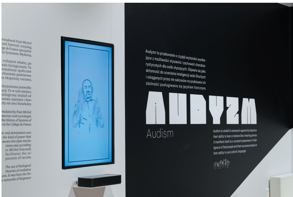
1. Wystawa Głusza , Muzeum Śląskie